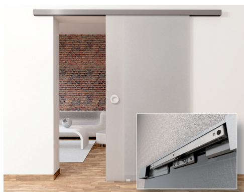
Flexible 2.0 50kg Glas plus beidseitige Einzugsdämpfung

In punkto Schiebetürenbeschläge bleibt bei Pollmeier kein Wunsch offen. Mit den Produktgruppen PUR und Flexible deckt das Hövelhofer Unternehmen die Gewichtsklassen von 40 bis 120 Kilogramm ab. Alle Be-